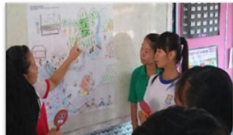
Gambar 4: Aktiviti murid membuat penerangan dengan hasil imaginasi