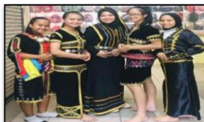
Gambar 11 dan 12: PBP: Keunikan Masyarakat (Pakaian Tradisional)