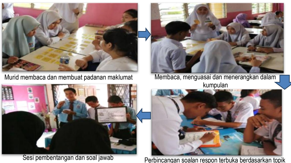
Murid membaca dan membuat padanan maklumat

TRUE MATCH merupakan kad permainan yang akan melibatkan murid dengan aktiviti suai padan kad permainan diikuti penerangan oleh murid berkaitan dengan topik “Perjuangan Tokoh-Tokoh Pemimpin Tempatan”. Gambar-gambar tokoh berkaitan telah dilukis dan maklumat berkaitan tokoh dikumpul seterusnya disusun bagi memudahkan penguasaan murid. Maklumat dan gambar dicetak dan dijadikan kad permainan suai padan. Satu set TRUE MATCH mengandungi 7 set kecil yang sesuai digunakan untuk aktiviti secara individu, berpasangan atau berkumpulan. Setiap set kecil juga dihasilkan dalam warna yang berbeza bagi memudahkan ianya diasingkan jika tercampur dengan set yang lain. (Hanita Ladjaharun, 2020). Guru-guru sejarah boleh menghasilkan kad permainan suai padan seperti TRUE MATCH bagi topik yang lain seperti Nasionalisme di Asia, Nasionalisme di Asia Tenggara dan Intelektual Islam. Gambar-gambar tokoh berkaitan juga mudah diperolehi dalam aplikasi Google sekiranya guru tidak berpeluang melukis atau melakar.