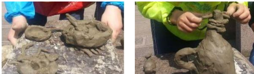
Gambar 5 dan 6: Murid menayakan aktiviti Modeling Tanah Liat

Guru boleh merancang aktiviti Model Tanah Liat bagi topik yang sesuai seperti zaman pra sejarah, zaman Kesultanan Melayu Melaka, seni bina di Alam Melayu dan mana-mana tajuk yang difikirkan sesuai. Aktiviti awal seperti menonton video atau mengkaji gambar boleh dilakukan selain lawatan sambil belajar ke muzium. Pengalaman dan gambaran awal akan meningkatkan daya imaginasi murid yang akan memudah proses menghasilkan Model Tanah Liat dan menjelaskan setiap objek yang dihasilkan. Guru-guru sejarah berpeluang melaksanakan aktiviti Model Tanah Liat kerana peralatan yang mudah diperolehi, aktiviti yang sesuai diaplikasikan dalam banyak topik sejarah serta sesuai untuk semua tahap murid di peringkat sekolah rendah dan menengah.