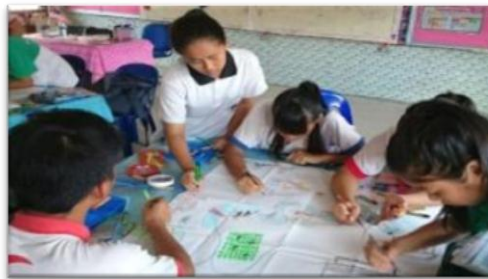
Gambar 3: Aktiviti murid membuat imaginasi dan melengkapkan lukisan asas

Melalui aktiviti LENG-AT murid akan membuat imaginasi berkaitan peristiwa sejarah dan berusaha melengkapkan gambar asas untuk menggambarkan peristiwa sejarah menggunakan crayon . Aktiviti ini diadakan secara berkumpulan agar murid dapat berbincang dan bekerjasama menghasilkan gambaran peristiwa sejarah. Semasa murid membuat imaginasi akan berlaku empati iaitu murid cuba memahami peristiwa sejarah berdasarkan latar masa, tempat dan zaman. Perbincangan dan percambahan idea dalam kalangan murid mendorong murid untuk lebih empati terhadap peristiwa yang dipelajari. Selepas selesai melengkapkan gambar asas, murid akan membentangkan hasil imaginasi di depan rakan-rakan. Pembelajaran akan diakhiri dengan aktiviti perbincangan soalan-soalan respon terbuka berkaitan dengan topik dipelajari.