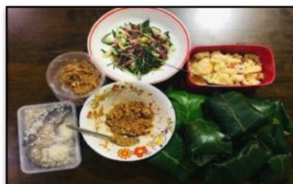
Gambar 13 dan 14: PBP: Keunikan Masyarakat (Makanan Tradisional)

Dalam menjayakan PBP, pelbagai EMK akan diaplikasikan secara serentak oleh murid seperti bahasa, kelestarian alam sekitar, nilai murni, patriotisme, sains dan teknologi, kreativiti dan inovasi, teknologi maklumat dan komunikasi serta kelestarian global. Suasana pembelajaran aktif yang berpusatkan murid dan bahan dapat diwujudkan yang membawa kepada empati sejarah. Aplikasi Science Technology Engineering and Mathematic (STEM) dan Science Technology Engineering Art and Mathematic (STEAM) juga akan berlaku semasa proses menghasilkan projek. Integrasi pelbagai kemahiran dan pengetahuan akan membolehkan murid mempunyai persepsi pentingnya sejarah dalam kehidupan seharian. Bagi menjimatkan kos, bahan-bahan kitar semula boleh digunakan dalam menjayakan projek. Penggunaan bahan kitar semula akan menerapkan nilai dan kreativiti dalam kalangan murid.